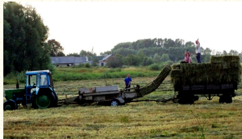
Косење во подрачје на Натура 2000, според Планот за управување на заштитено подрачје (Литванија)