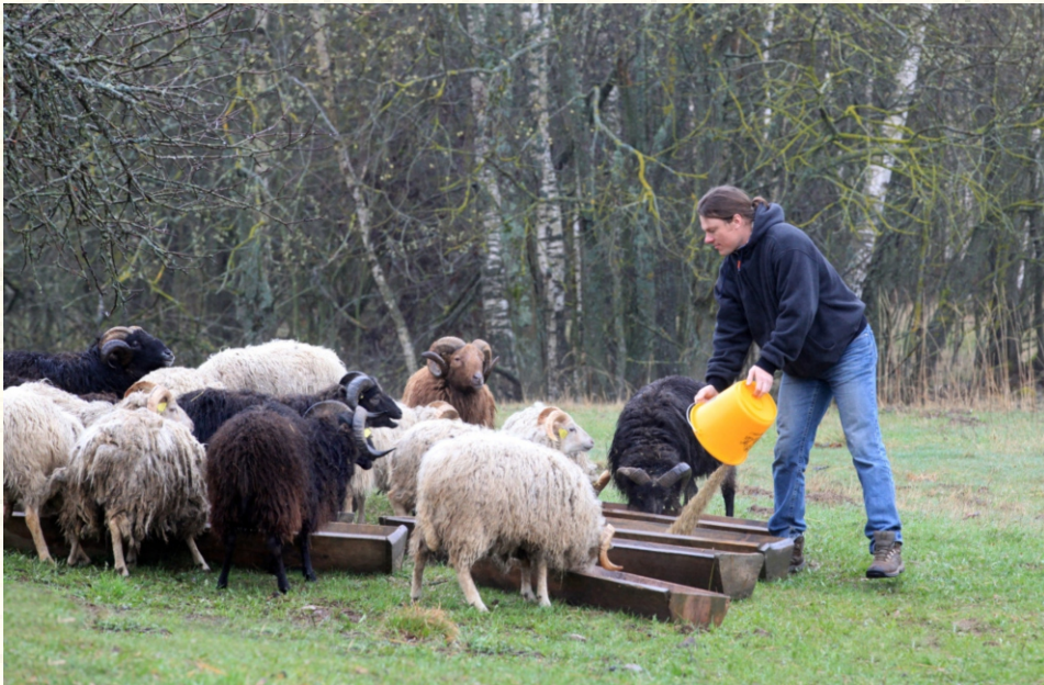
Пасење на овци со приватен сопственик за да се одржуваат отворените падини на Националниот парк Аукштатија, како Натура 2000 подрачје (Литванија)

Всушност, во многу подрачја, живеалиштата и видовите кои таму се застапени се целосно зависни од континуитетот на таквите активности за нивниот долгорочен опстанок, па во такви случаи, важно е да се изнајдат начини да се поддржат, а доколку е потребно и да се зајакнат таквите активности, како што се на пример редовното напасување, или кастрење на грмушките.