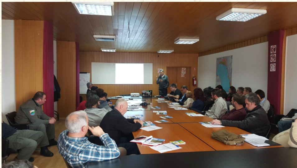
Дискусија за Планот за управување со потенцијалното Натура 2000 подрачје на Преспанското Езеро (Северна Македонија)

Плановите за управување се корисна алатка со која што се планираат активностите кои ќе се спроведуваат на подрачјето, со цел истото да се сочува во поволен конзервациски статус во однос на живеалиштата и видовите кои што се од значење за ЕУ. Овие планови се прават согласно потребите на секое поединечно подрачје и даваат можност за консултација со засегнатите страни (органите на управување со заштитените подрачја, локалната самоуправа, невладините организации, локалните заедници итн.).