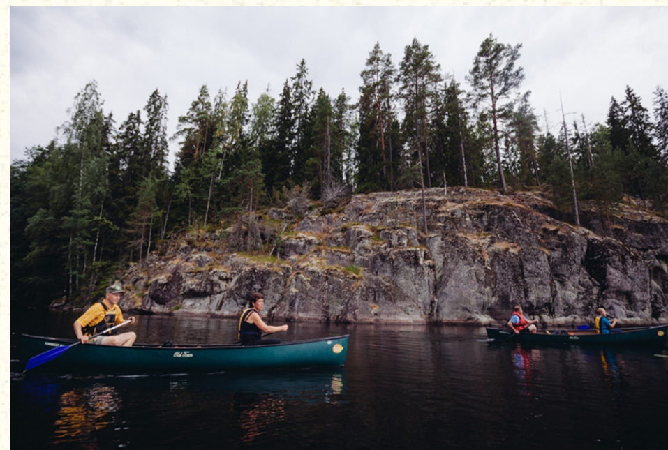
Кајакарски тури со водич во Националниот парк Нуксио, како Натура 2000 подрачје (Финска)

Ваквите рекреативни активности се во согласност со одредбите од Директивите за живеалишта и птици, доколку истите не влијаат негативно врз присутните живеалишта и видови. Клучот најчесто се крие во планирањето и рационалното користење на ресурсите, на начин што нема да се нарушат вредностите кои што се основа на нивното постоење.