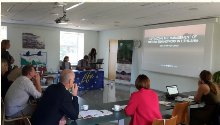
Интегриран LIFE проект во Литванија “Оптимизирање на управувањето со мрежата на Натура 2000 во Литванија”

Програмата Лајф -LIFE е единствената, европска програма, исклучиво наменета за финансирање на проекти од областа на животната средина и зачувување на природата во земјите на ЕУ (но и во земјите кандидати за ЕУ, земји во процес на пристапување кон ЕУ и во земјите соседи). Спроведуваните проекти под покровителство на оваа програма ги обезбедуваат очекуваните резултати од вложените средства, осигуруваат и обезбедуваат работни места, помагаат во воспоставување на иновативни проекти низ ЕУ и вродуваат со задоволителни, конкретни резултати.