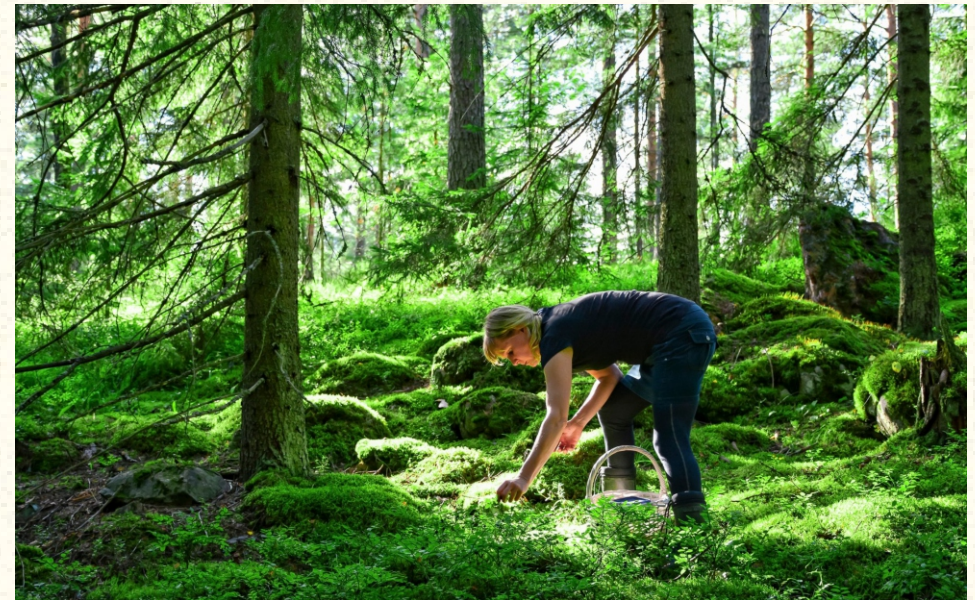
Богатствата на шумите Бобинките растат природно во дивите шуми на Финска, една од најчистите средини на светот

Ефективното управување со подрачјата на Натура 2000 подразбира блиска соработка меѓу релевантните институции за заштита на природата и за шумарство, приватните и државните сопственици на шума, други засегнати страни и невладини организации. Притоа, многу е важно истите да постигнат меѓусебен договор, којшто ќе биде соодветен и ќе оди во насока на исполнувањето на законските права и интереси на засегнатите страни.